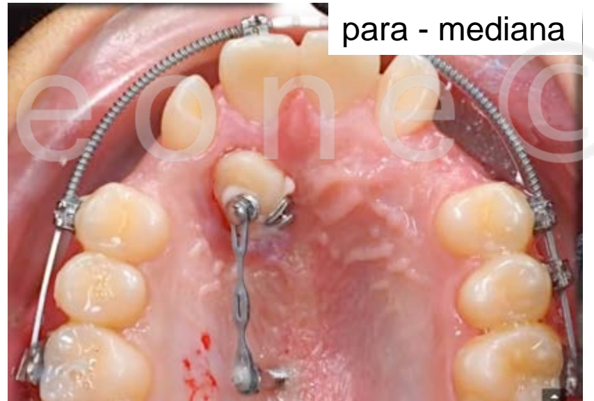
para - mediana