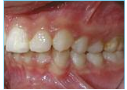
Fig. 2a-2b-2c Foto intraorale iniziale frontale, foto intraorale iniziale laterale destra e foto intraorale iniziale sinistra