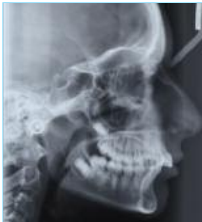
Fig. 5a-5b Teleradiografia laterale iniziale e valori cefalometrici iniziali