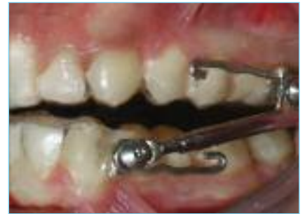
Fig. 3a-3b-3c Foto intraorale con Herbst frontale, foto intraorale con Herbst laterale destra, e foto intraorale con Herbst laterale sinistra