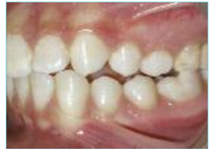
Fig. 7a-7b-7c Foto intraorale finale frontale, foto intraorale finale laterale destra, e foto intraorale finale laterale sinistra